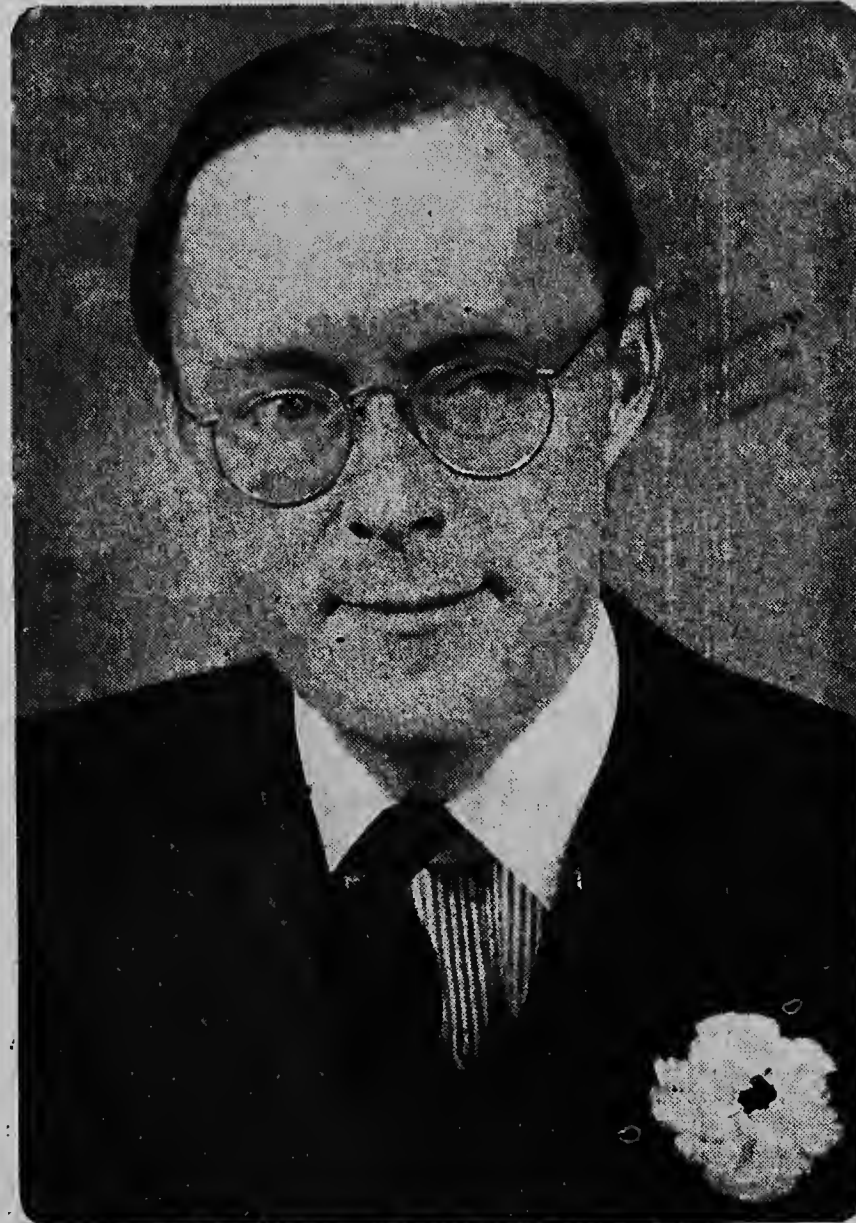
Z. K. H. PRINS BERNHARD

Wat in de komende drie dagen echter gaat plaats vinden zal evenwel vast en zeker met gouden letters in het geschiedenisboek van Aruba worden opgenomen. Dit eerste bezoek van een regerende Vorstin van Nederland, de Nederlandse Antillen en Suriname aan Aruba is een geweldig feit, dat in grootheid nog nooit op Aruba geëvenaard werd. Onze Koningin Juliana en Prins Bernhard zullen heden voet op Arubaanse bodem zetten en drie dagen te midden van ons verkeren!